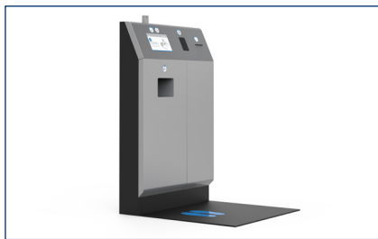
Terminalversion mit Drucker